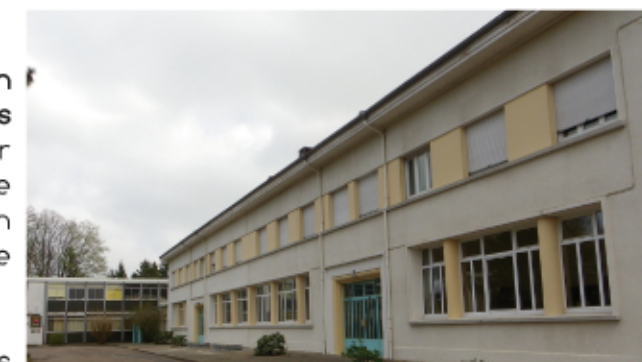
Une réflexion est en cours concernant le devenir des collèges de Blâmont, Cirey, Badonviller et Bénaménil

Une grille tarifaire unique pour l'ensemble des collèges a pris effet à la rentrée de septembre 2010. 3 tarifs indentiques sur tout le département prennent en compte les revenus des familles tout en maintenant l'aide financière du conseil général à destination de tous. Ainsi, pour un repas coûtant environ 6 euros, les familles paient selon leurs revenus : 1.70€, 2.70€ ou 3.70€. A la rentrée de septembre 2011, nous avons fait le choix de relever les seuils de quotient familial, afin que davantage de familles bénéficient des tarifs à 1.70 ou 2.70€. Une décision qui permet à plus de collégiens de prendre chaque jour un repas équilibré à la cantine, et qui participe à l'amélioration du pouvoir d'achat des familles.